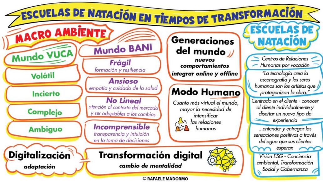
Figura 1. Resumen visual del documento “Escuelas de natación en tiempos de transformación”.